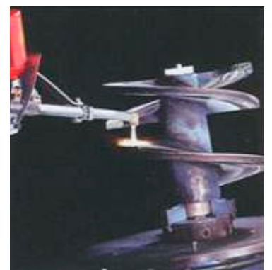
Revestimento de uma rosca de extrusão de cerâmica com a liga SF 15211.