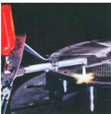
Revestimento de um Hydropulper (Papel) com Eutalloy SF 15211