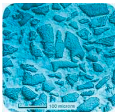
A distribuição densa e homogênea dos carbonetos de tungstênio na matriz, permite alta resistência à abrasão.